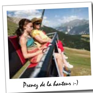
Prenez de la hauteur :-)

L'été, aux portes du Parc National de la Vanoise, Aussois est le point de départ idéal pour les randonnées en famille, les courses en montagne à la découverte de la faune et de la flore.