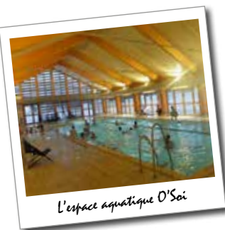
L'espace aquatique O'Soi

Envie de vous détendre ou, tout simplement de « piquer une tête » ? Rendez-vous à l'espace aquatique d'Aussois « O'Soi » avec son bassin de 115 m 2 et une partie en bain bouillonnant. Avec une profondeur comprise entre 60 et 150cm ainsi qu'une pataugeoire, petits et grands ont de quoi se tremper les pieds et bien plus encore !